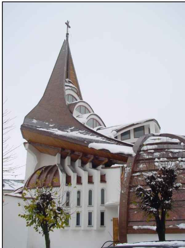
Ansamblul arhitectural In Memoriam, Biserica Na terea Maicii Domnului